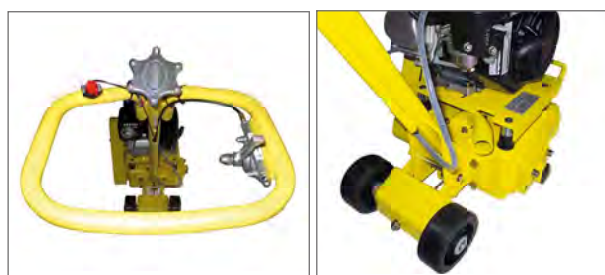
Poignée de guidage