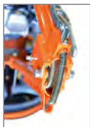
Bras pliant à ressort innovant