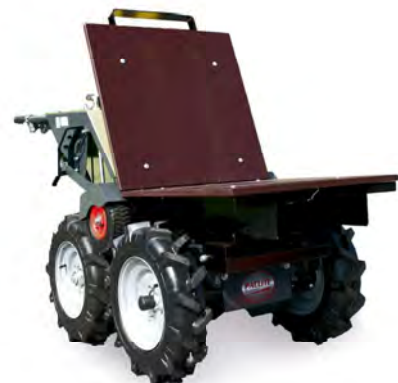
Plateau toujours inclus