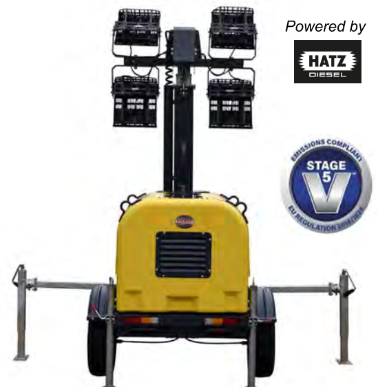
NON TRACTABLE DUR ROUTE