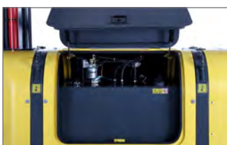
Capot d'ouverture, des composants en carbone pour réduire le poids