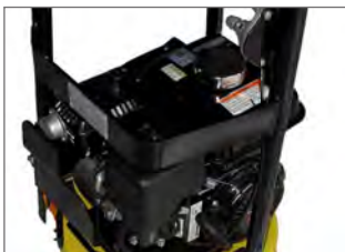
Cadre de protection