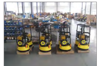
Monté en grande série