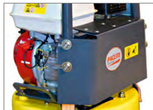
Capot de sécurité