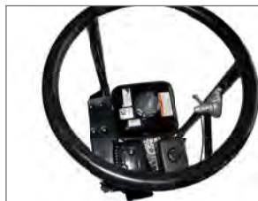
Accélérateur placé au centre sur la poignée