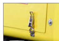
Capot de service ouvrable