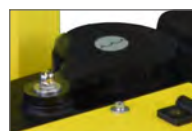
Réservoir d'eau 47 L