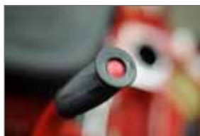
Elektrisches Spritzsystem im Handgriff