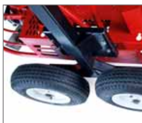
Transporträder 'Dolly jacks'