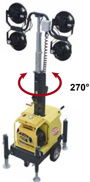
PLUG-IN & GO HYBRID