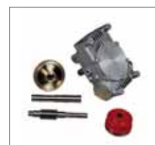
PACLITE tillverkar egna växellådor som är de bästa i branschen med två års garanti.