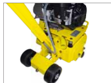
Presca per raccogli polvere