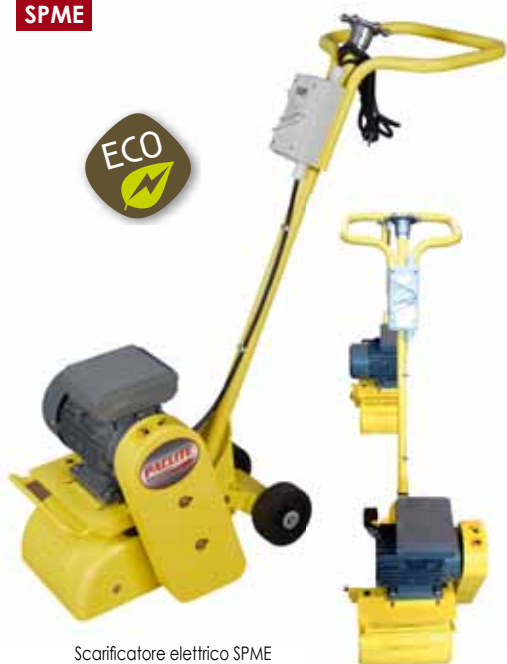
Scarificatore elettrico SPME