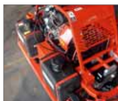
Due serbatoi d'acqua