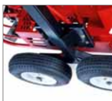
Ruote di trasporto 'Dolly jacks'