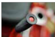
Sistema a spruzzo incorporato nel manico