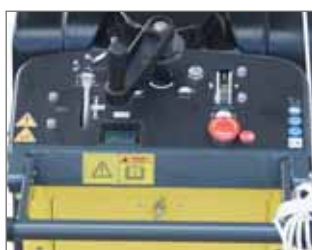
Pannello di controllo avanzato con conta ore