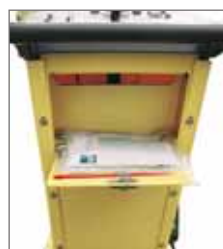
Porta documenti e attrezzi