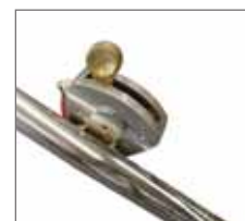
Interruttore di sicurezza