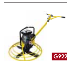
G922- Modello economico con manico diritto