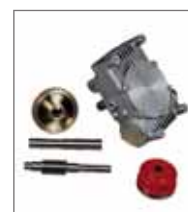
I riduttori PACLITE sono i più affidabili del settore, garantiscono anni di lavoro con manutenzione minima