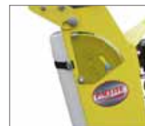
Diametro massimo della lama 450 mm