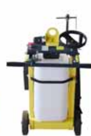
Gancio di sollevamento centrale