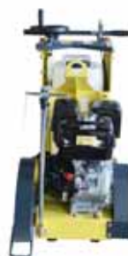
Serbatoio d'acqua 25 L