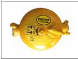
Lubrificateur en ligne Code : PAC-LUB

Quel que soit le modèle que vous choisissez, tous les marteaux-piqueurs de la gamme PACLITE sont conçus pour vous fournir la meilleure performance dans leur catégorie de poids.