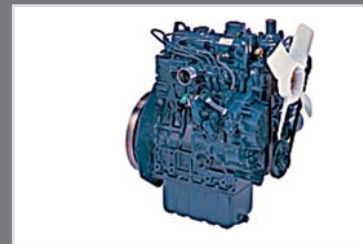
Impulsado por KUBOTA 1505-TE3B