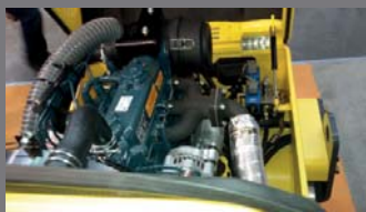
Motor KUBOTA montado directo en línea para facilidad de servicio y mantenimiento.