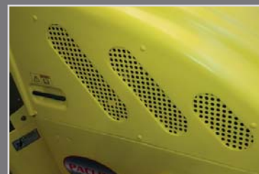
Cubierta de fibra de vidrio