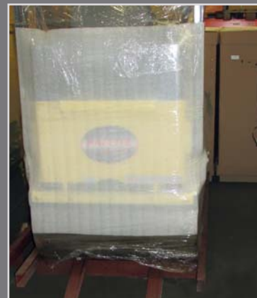
Rodillo tiene riel de soporte para transportar