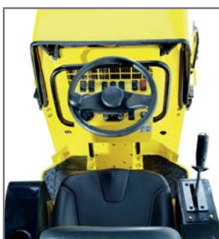
Comodidad para el operario